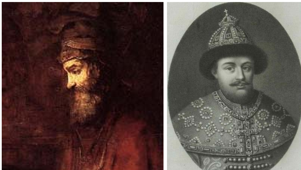
Рис. 3. Портрет «неизвестного» с картины Рембрандта и портрет царя Алексея Михайловича.

Еврей Рембрандт, половину своих полотен, посвятивший тематике священного писания, по-видимому, был посвящен в тайну параллельного, аллегорического летописания текущей истории. Следил за событиями в европейской жизни и в частности в России. Ведь не даром, ряд его полотен посвящен сюжетам о царе Давиде (Давид и Урия, Давид и Саул, Давид и Ионафан, Вирсавия), т.е. согласно работе (2), русскому царю Михаилу Романову.