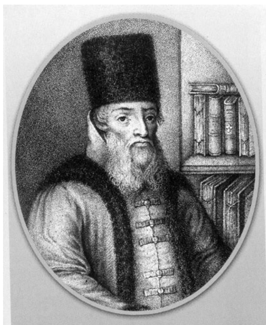
Рис. 2. «Отец» с картины Рембрандта и портрет Ордин-Нашекина.

Определенное сходство можно найти и между ликами молодого царя Алексея и «неизвестного» с картины Рембрандта.