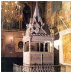
Рис. 13. Мономахов трон в Успенском Соборе.

Москва. Считается, Успенский Собор в Москве начали строить в конце XV века, но росписи северной, западной и южной стен собора приступили только в 7021(1521) году. Но только при Иване Васильевиче в лето 7059(1559) «резчики по дереву изготовили и установили в храме узорочное «царское место», или, как его стали называть, «Мономахов трон». Рассказывают, что когда при подготовке к коронации Екатерины I этот трон хотели убрать из собора, то Петр I сказал: «Я сие место почитаю драгоценнее золотого за его древность, да и потому, что все державные предки, Российские государи на нем стояли». (Низовский, 8) Успенский Собор с самого начала мыслился как царский собор. Поэтому и он был закончен тогда, когда Иван Васильевич приказал поставить в храме Мономахов трон – в лето 7059 (1559) .